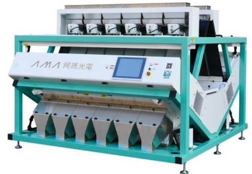
智睿 6SXM-756S+ 靠背機型