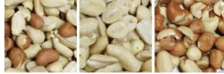
原料 成品 帶出