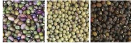
原料 成品 帶出