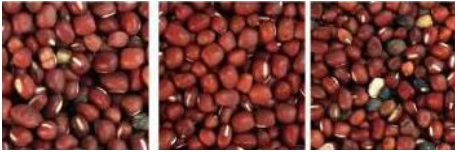
原料 成品 帶出