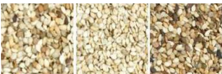
原料 成品 帶出