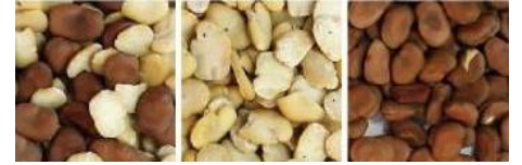
原料 成品 帶出