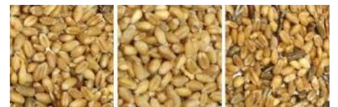
原料 成品 帶出