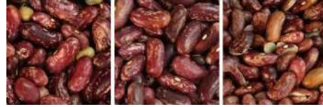
原料 成品 帶出