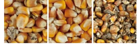
原料 成品 帶出