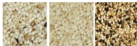
原料 成品 帶出