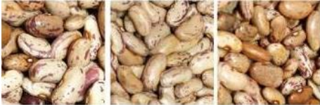
原料 成品 帶出