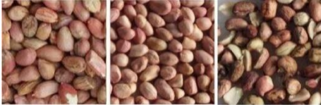
原料 成品 帶出