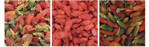
原料 成品 帶出