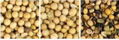
原料 成品 帶出