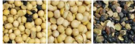
原料 成品 帶出