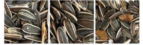
原料 成品 帶出