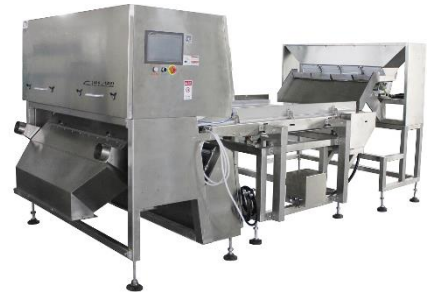
L系列皮帶式色選機